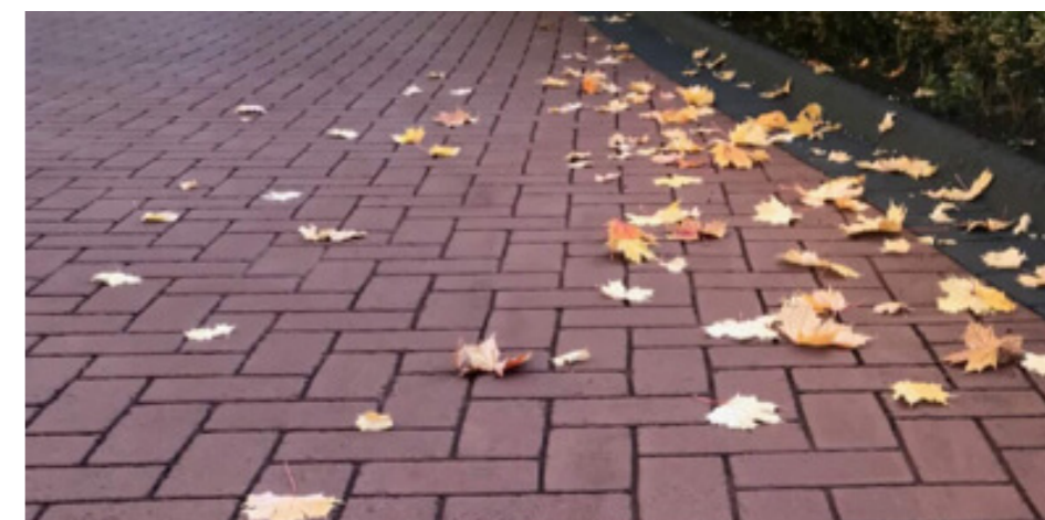
Rood asfalt met StreePrint