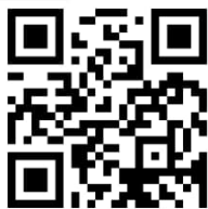
Figuur 1: QR-code KWS App Android

Blijf eenvoudig op de hoogte door de app te downloaden. Het project 'Herinrichting Gildeweg' volgt u eenvoudig door deze als 'favoriet' aan te vinken. De KWS app is beschikbaar voor iOS en Android en gratis te downloaden in de Apple- en Google app store.